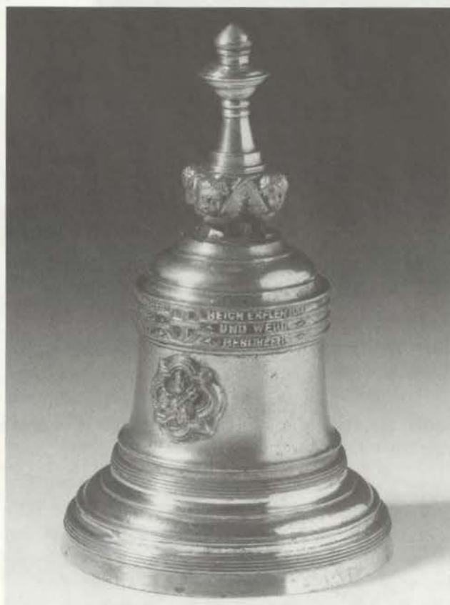
Miniaturausgabe der „Gloriosa“ des Kölner Doms, genannt „Kaiserglocke“, nach 1875 (Ansicht mit heiligem Petrus)

Über Reichsadler und heiligem Petrus im Vierpass Inschrift: „DIE KAISER GLOCKE HEISS ICH/ DES KAISERS EHREN PREIS ICH/AUF HEILGER WARTE STEH ICH/ DEM DEUTSCHEN REICH ERFLEH ICH/ DASS FRIED UND WEHR/ IHM GOTT BESCHER