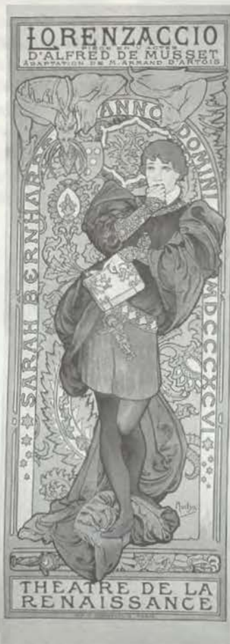
Alfons Mucha (Ivance 1860–1939 Prag) Sarah Bernhardt als „Lorenzaccio“ (kleine Ausgabe), 1896 Farblithographie von vier Platten, 105,2 x 37,7 cm, Inv. Nr. LGA 29

Am 2. und 23. Juni findet jeweils um 19 Uhr eine Themenführung „Symbolismus und Jugendstil“ statt (Graphische Sammlung)