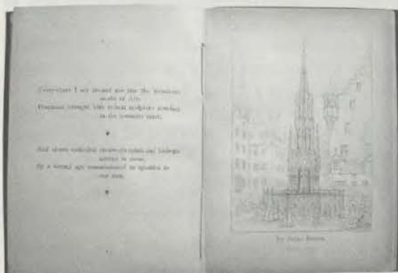
Longfellow: Nuremberg, 3. Ausgabe, Brunnen

Ansicht des Chors am Pfarrhof St. Sebald verbunden. Während die Illustrationen der Erstaussgabe mit einer Stadtansicht als Einleitungsvignette, zwei Ansichten der Burg und vier Ansichten von St. Lorenz stark auf diese Kirche konzentriert sind, so wird bei der 2. und in der mit ihr identischen 3. Ausgabe eine größere Ausgewogenheit zu den Denkmälern Nürnbergs angestrebt. Bis auf die zwei in der ersten Ausgabe verwendeten Ansichten der Burg sind die Illustrationen alle dem Werk „Nürnberg's Gedenkbuch. Eine vollständige Sammlung aller Baudenkmale, Monumente und anderen Merkwürdigkeiten dieser Stadt. In Stahlstichen nach Originalzeichnungen von J. G. Wolff. Mit Beschreibungen von Dr. Friedrich Mayer“ entnommen, das als Lieferungswerk in einer ersten Auflage zwischen 1843 bis 1854 im Verlag J. L. Schrag erschien und in den Jahren 1858 bis 1910 eine zweite Auflage erlebte.