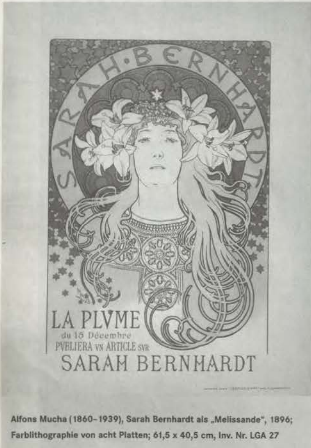
Alfons Mucha (1860–1939), Sarah Bernhardt als „Melissande“, 1896; Farbliothographie von acht Platten; 61,5 x 40,5 cm, Inv. Nr. LGA 27

Entsprechend ist die Sammlung keine museale, sondern eine Lehrsammlung, deren Objekte in erster Linie Schulungszwecken dienen. Die Mustersammlung beinhaltet kunstgewerbliche Anschauungsobjekte aller Materialbereiche aus dem In- und Ausland, die Bibliothek naturwissenschaftliche und kunsthandwerkliche Schriften, Lexika, Ausstellungskataloge, Ornamentstichwerke. Die umfangreiche graphische Vorbildersammlung besteht aus Konvoluten von Zeichnungen, Graphiken,