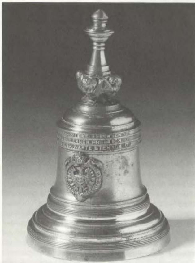
Miniaturausgabe der „Gloriosa“ des Kölner Doms, genannt Kaiserglocke, nach 1875 (Ansicht mit Reichsadler)