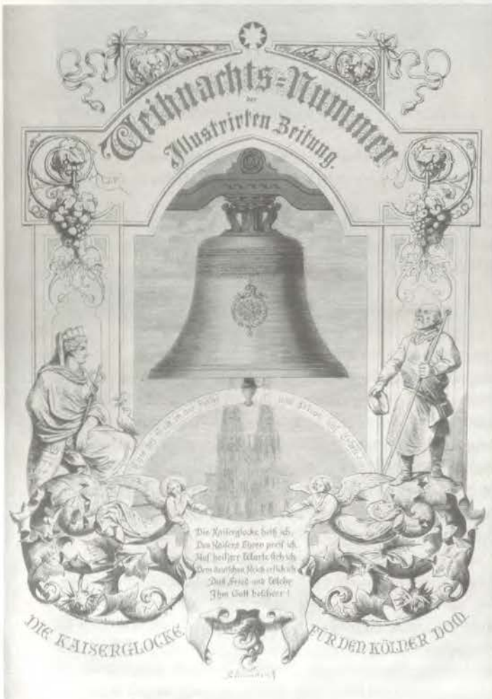
Weihnachts-Nummer der Illustrierten Zeitung, Leipzig 19. Dezember 1874 (Titelseite)

Die in Leipzig erscheinende Illustrierte Zeitung schmückte 1874 die Titelseite ihrer Weihnachtsausgabe mit der Kaiserglocke. Auf der folgenden Seite findet man ein Gedicht von Ernst Scherenberg, das am Ende jeder Strophe einen Satz aus der deutschen Glockeninschrift zitiert und dessen erste Strophe lautet: „Du Riesenglocke im Riesendom, / Sag an, wem wirst Du läuten? - / Dem Kaiser verdank ich Trophäenmetall, / Des Kaisers Siege beweis ich; / Dem Kaiser drum gilt mein gewaltiger Schall, / Die Kaiserglocke heiß ich!“