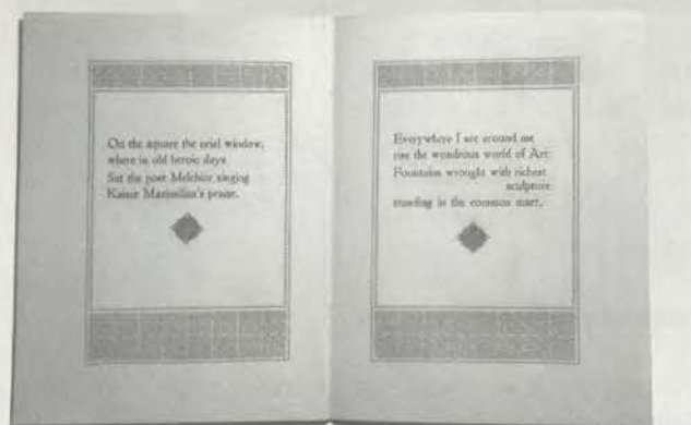
Longfellow: Nuremberg, 4. Ausgabe, Brunnen

1844 verfasste er das Gedicht „Nuremberg“, welches in den USA erstmals 1844 in Graham's Literaturmagazin veröffentlicht wurde. Das vollendete Gedicht sandte er an Freiligrath, der es ins Deutsche übersetzte und 1847 in einem Band „Gedichte aus dem Englischen“ publizierte. Neben der Publikation im Rahmen von Gedichtsammlungen erlebte das Gedicht acht bisher bekannte monographische Ausgaben in der Originalsprache, denen offensichtlich als letzte eine zweisprachige (Englisch / Deutsch) Ausgabe im Jahre 1928 folgte. Davon erschienen sechs in Nürnberg, während zwei weitere Ausgaben 1888 in Philadelphia bzw. in London herausgebracht wurden.